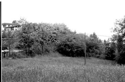
> 10 anni dopo