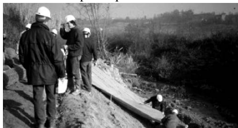
> Attività pratico-didattica

Quindi sono stati fatti gli altri interventi: > difesa spondale viva per 4 m. di altezza lungo la sponda, tramite posa di reti in fibra naturale vincolate con rete metallica zincata, fissata con picchetti in ferro ripiegati a U e corde in acciaio dello spessore di 5 mm correnti in diagonale ed opportunamente fissate con morsetti serrafune a tondini in acciaio opportunamente lavorati anch'essi a U, lunghi almeno 1 m. e completamente infissi nel terreno, in numero di 4 ogni mq., previa regolazione della scarpata ed inerbimento della medesima mediante semina a spaglio di idoneo miscuglio. Il tutto consolidato al piede tramite realizzazione di fascinatura di sponda semisommersa alternata a massi di volume non inferiore a 0.8 mc. Inserimento di talee sulla rete in fibra vegetale in numero di 10 per mq.