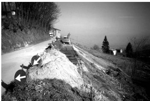
> In corso lavori