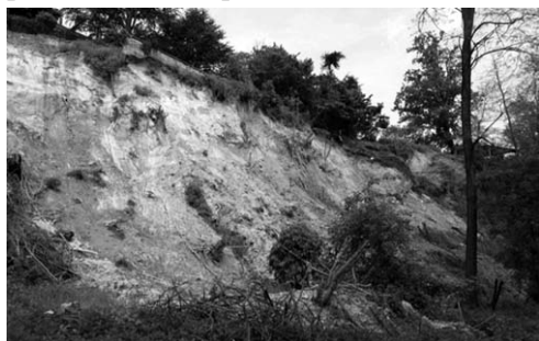
› Stato di fatto iniziale del dissesto in atto

Il sito è di tipo sedimentario detritico, costituito da alternanze di argille, marne, sabbie e arenarie con conglomerati. Nel versante in oggetto si rinviene la formazione delle sabbie di Asti , Pliocene Superiore, al di sotto della coltre eluvio-colluviale di modesto spessore. L'area, interessata da movimento gravitativo, ricade parte in Classe IIIa1 e parte in Classe IIIa3, inidonee a nuovi insediamenti. La scarpata si è formata a seguito dell'attività erosiva del torrente Borbore, quindi, per l'elevata acclività, questa è andata progressivamente arretrando, aggravandosi in seguito agli intensi eventi meteorici degli ultimi anni, è stata interessata ad un movimento gravitativo di tipo rotazionale passante a colata per fluidificazione del terreno.