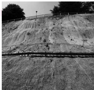
> Lavori appena ultimati nell'autunno 2010

fronte di frana e consolidare il giardino del castello esistente a monte; > realizzazione di palizzata di sostegno al piede del versante consolidato con funzione di raccolta e regimazione delle acque meteoriche, oltre che sostegno di stradina di servizio; > idro-semina e rivegetazione con specie arbustive autoctone.