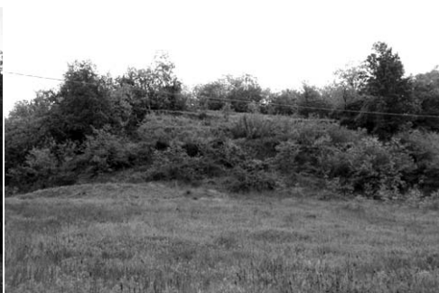
> 5 anni dopo