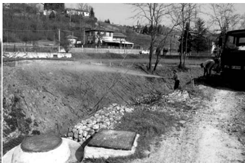
> Idrosemina sulle viminate