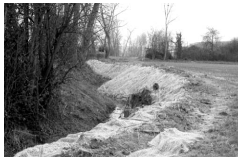
> Consolidamento delle sponde riprofilate

Inoltre si è proceduto a: > risparmio economico per la rinaturazione delle sponde , che praticamente dimezza l'importo del ripristino, > accentuazione della naturale meandrizzazione del corso d'acqua; > possibilità del drenaggio naturale delle acque piovane dai campi coltivati. Si sono fatte opere di consolidamento spondale con tecniche d'ingegneria naturalistica, che sono consistite in: > rivestimento con geostuoia di juta armata con talee di salice di tutti i tratti di sponda modificati; > palificate di sponda rinverdite ; > gabbionate rinverdite ; > piantagioni di alberi ed arbusti propri delle cenosi vegetali proprie degli habitat ripari.