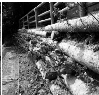
> Primavera 2011