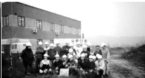
> Foto ricordo di un gruppo di volontari