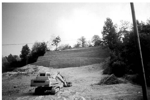
> A lavori ultimati