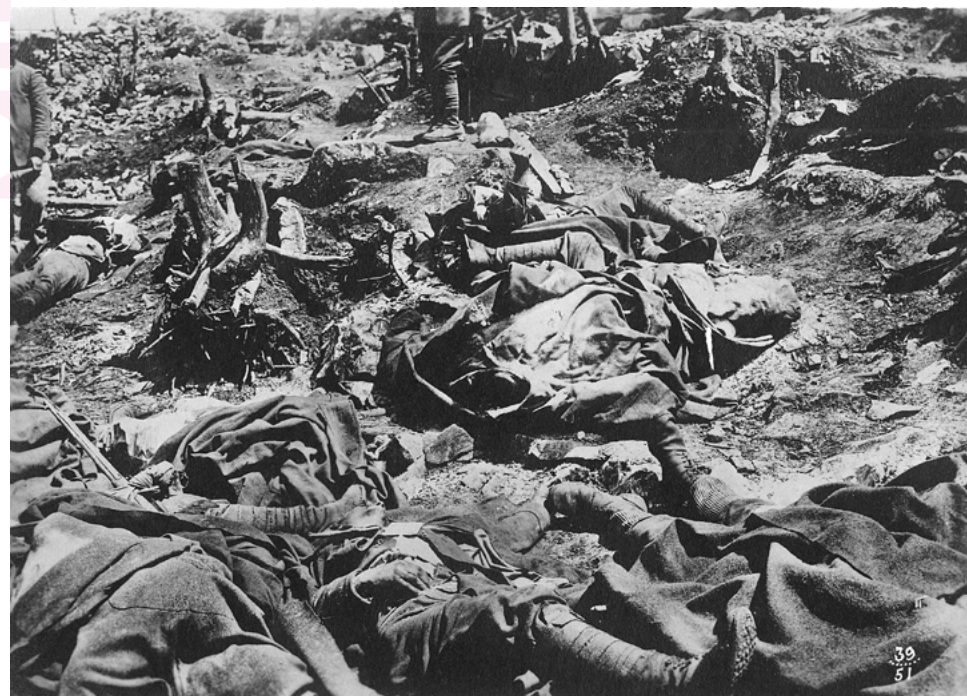
Corpi sul campo di battaglia

Intanto questa responsabilità non è tanto degli insegnanti, ma di tutti gli uomini. Quel