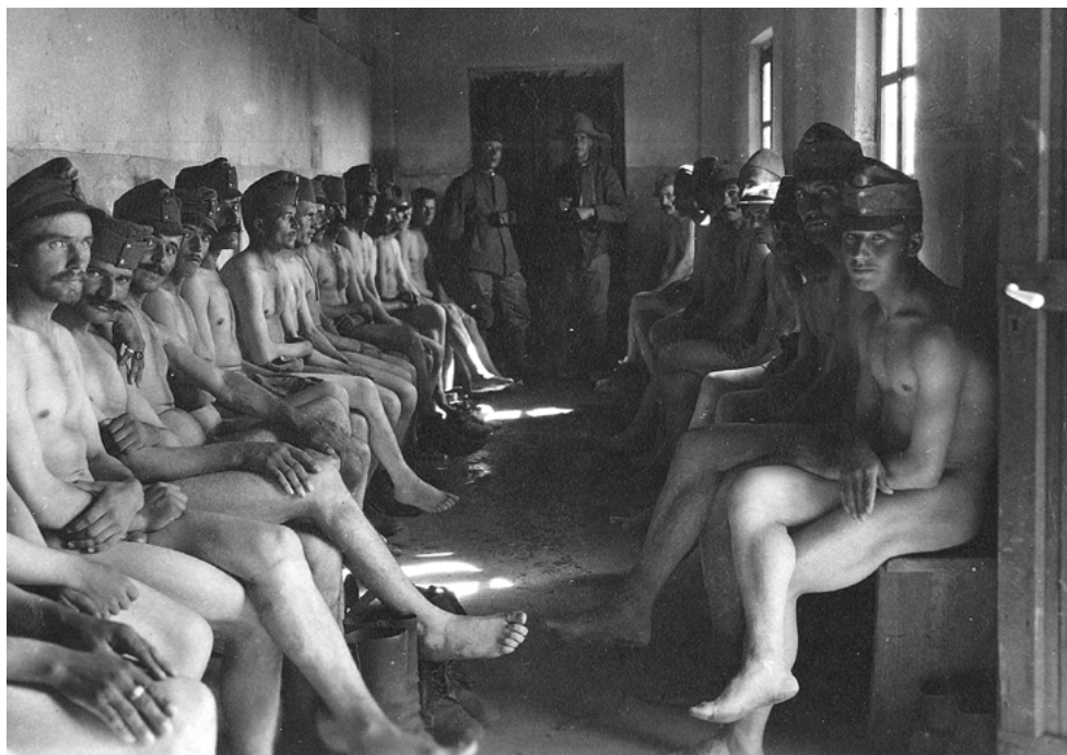
Soldati austriaci prigionieri

parte più significativa del film è “l’aspetto principale per un immigrato, cioè il rinnovo del permesso di soggiorno, che in Italia è ancora troppo legato all’aver un lavoro e al versamento di una cifra piuttosto elevata”.