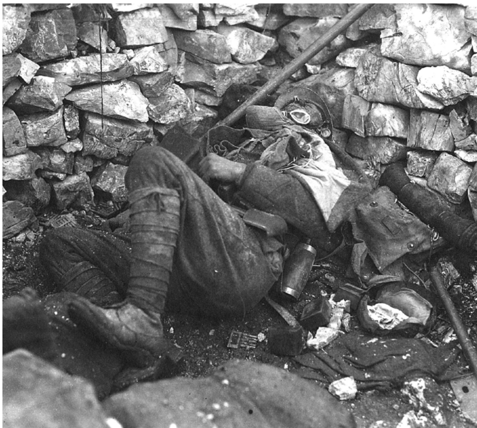
Morto per gas asfissiante sul S. Michele