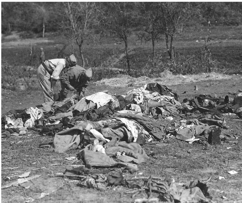
Il recupero dei soldati morti

effetti benefici su numerosi aspetti, come ad esempio la conservazione del patrimonio edilizio esistente, la salvaguardia dell' assetto idrogeologico ed il mantenimento e la valorizzazione delle produzioni agricole di qualità.