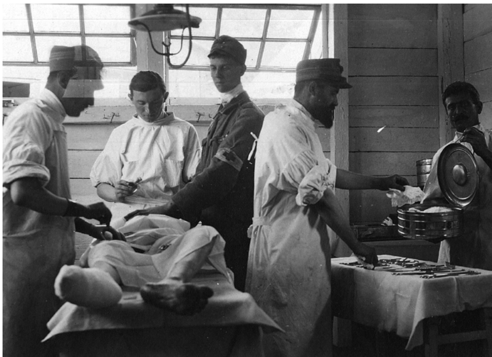
Nella corsia dell'ospedale

scuola. Si richiama la necessità di una nuova modalità di reclutamento della dirigenza, nella consapevolezza che l'ultima tornata concorsuale, peraltro durissima in quanto a selezione, ha manifestato molti limiti di procedura e di efficacia.