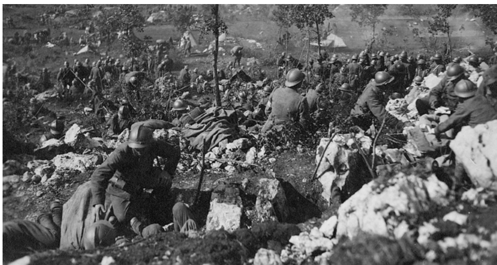
Rincalzi a quota 208 Nord