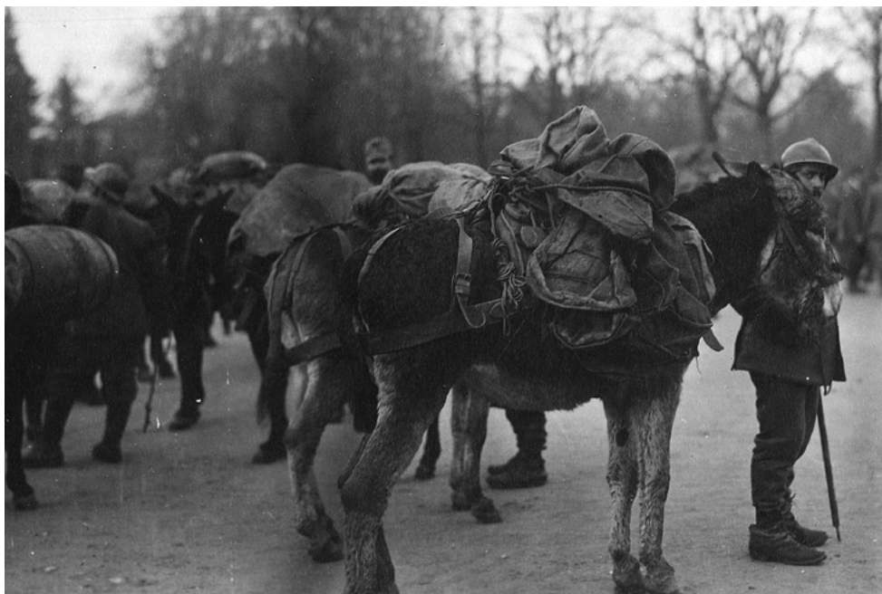
I muli trasportano vettovaglie e armi

(intervento alla 10a Giornata della Custodia del Creato, Pino d'Asti, 6 settembre 2014)