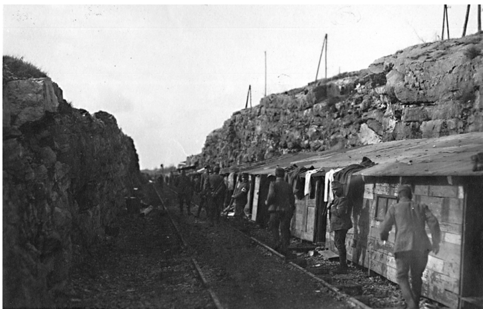
Le baracche dei soldati