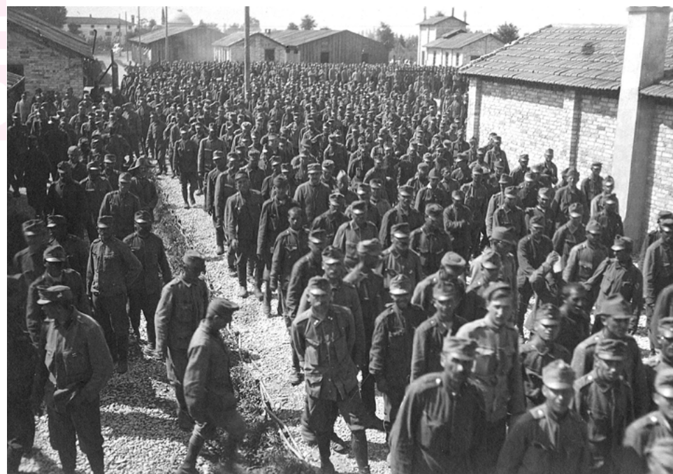
Sfilano i prigionieri austriaci

vo ambiente di apprendimento che andasse oltre le barriere dello spazio e del tempo scolastici (il cloud permette infatti anche la prosecuzione del lavoro cooperativo a casa) e oltre i limiti imposti dalla lezione dell'insegnante e dal manuale adottato.