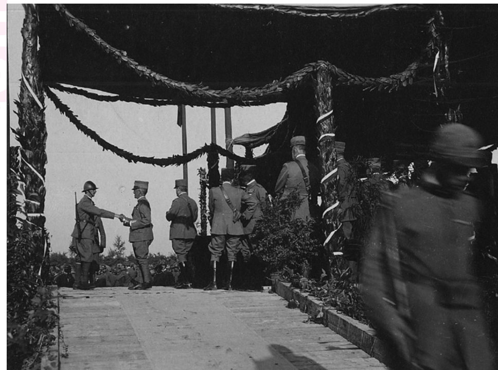
Il re Vittorio Emanuele III consegna una onorificenza a un soldato

invecchiata in Langa e Monferrato e attraversa una grave crisi. In alcune aree una grande quantità di terreni può essere acquistata a prezzi bassi e sta scomparendo l'identità delle comunità rurali.