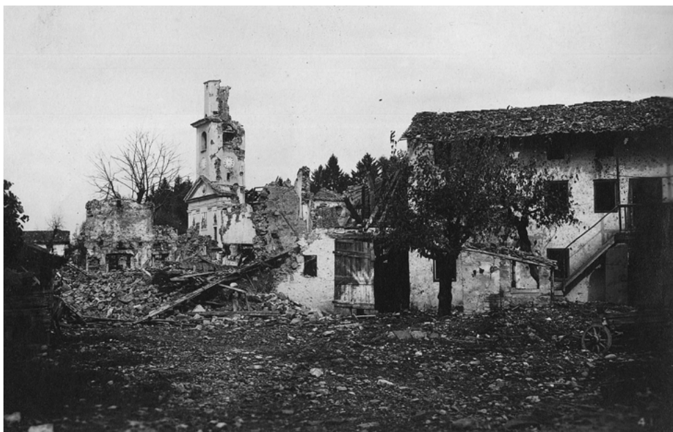
S. Pietro di Gorizia distrutto dai bombardamenti