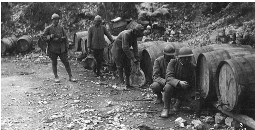
Rifornimento d'acqua dalle botti

proccio non partigiano. E' chiaro che se uno decide di fare un documentario del genere si schiera. Quello che voglio dire che il mio film non è un volantino, è un insieme di ritratti di persone molto diverse tra loro, che, loro malgrado, hanno incontrato nella loro storia la vicenda della lotta sull'alta velocità Torino-Lione. Sono persone diversissime persone comuni, anarchici e chi sedeva nelle istituzioni, e hanno scoperto di essere state tradite.