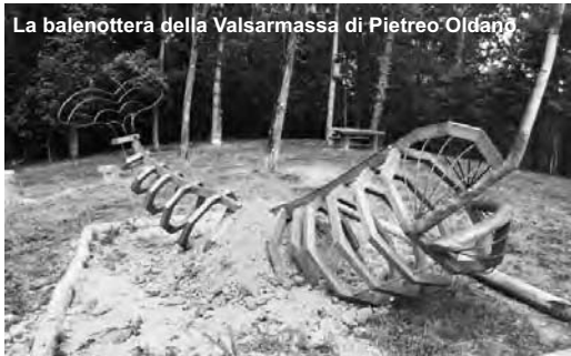
La balenottera della Valsarassa di Pietreo Oldano

cettare pioggia e nebbia e coprirsi di neve.