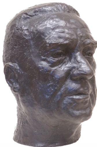
Busto di Davide Lajolo

La fantasia dell'artista investe la tua, la scuote, la fa vibrare. Diventi artista a tua volta Davide Lajolo