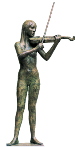
Omaggio alla musica (n° 2)