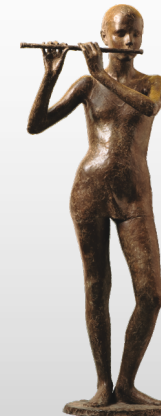
Adolescente con il flauto